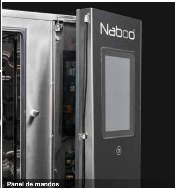
Panel de mandos