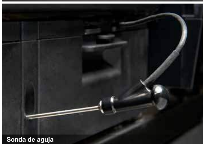
Sonda de aguja