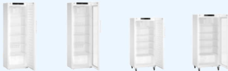
HMFvh 4001 HMFvh 4011 HMFvh 5501 HMFvh 5511 Antigo: MKv 3910 001 Antigo: MKv 3913 001 Antigo: MKv 5710