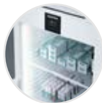
Luz LED vertical