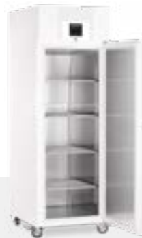
LGPv 6520 CONGELADOR DE LABORATORIO VENTILADO -9°C/-35°C