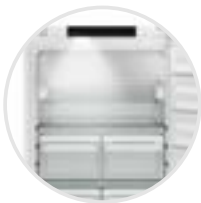
Luz LED frontal