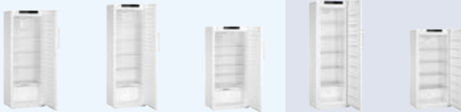
SRFfg 3501 SRFfg 4001 SRFfg 5501 SFFfg 4001 SFFfg 5501 Antigo: LKexv 3600 / 2600 Antigo: LKexv 3910 Antigo: LKexv 5400 Antigo: LGex 3410