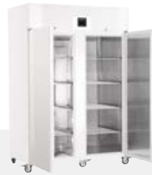
LGPv 1420 CONGELADOR DE LABORATORIO VENTILADO -9°C/-26°C