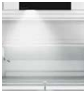
Iluminación LED interior