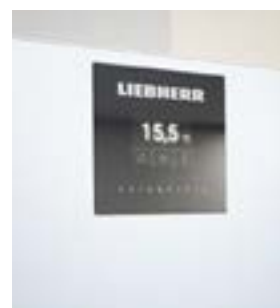
Electrónica avanzada • Pantalla a color 2,4" • Táctil - tocar y deslizar