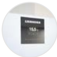
Display electrónica avanzada