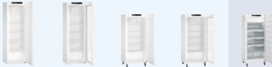
SRFvh 4001 SRFvh 4011 SRFvh 5501 SRFvh 5511 SFFvh 5501 Antigo: LGv 5010