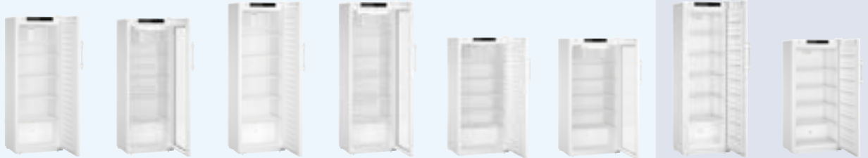
SRFvg 3501 SRFvg 3511 SRFvg 4001 SRFvg 4011 SRFvg 5501 SRFvg 5511 SFFsg 4001 SFFsg 5501 Antigo: LKV 3910 Antigo: LKV 3913 Antigo: LKV 5710