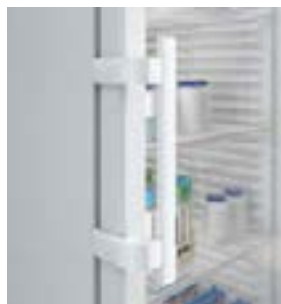
Tirador antimicrobiano con mecanismo de apertura