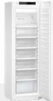
SFFsg 4001 cajones 6 CAJONES -9°C / -30°C