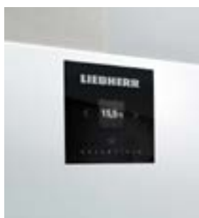
Electrónica básica • Pantalla monocromática • 3 botones táctiles