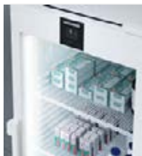
Iluminación LED vertical