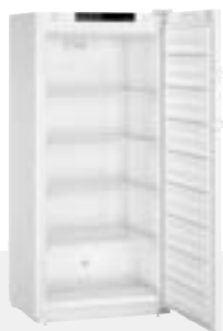
SFFsg 5501 4 ESTANTES -9°C / -30°C