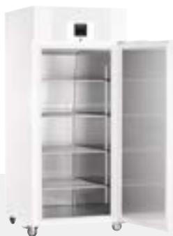
LGPv 8420 CONGELADOR DE LABORATORIO VENTILADO -9°C/-35°C