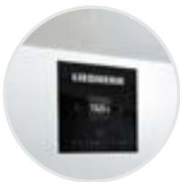
Display electrónica básica.