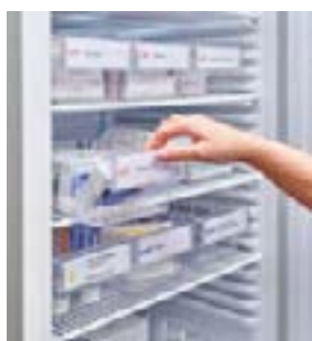
Estabilidad de la temperatura óptima