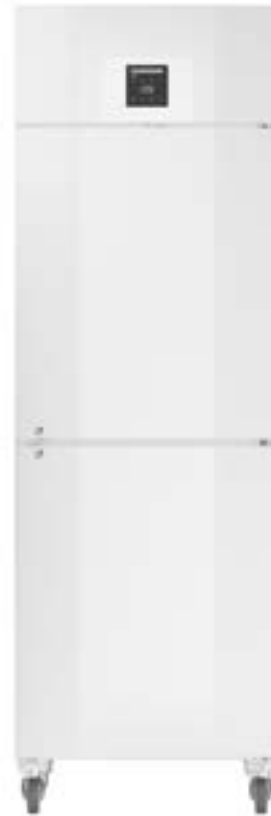
LGPv 6527 CONGELADOR DE LABORATORIO VENTILADO -9°C/-35°C