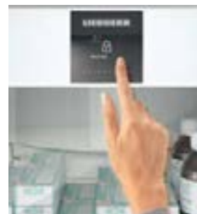
LightAlarm y SmartLock