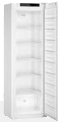
SFFsg 4001 6 ESTANTES -9°C / -30°C