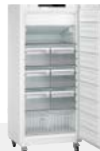
SFFVh 5501 4 ESTANTES REGULABLES 6 CAJONES / 2 CESTOS -9°C / -30°C