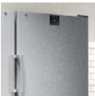
Equipos de acero inoxidable

Los electrodomésticos de la serie Perfection ofrecen todo lo necesario para cumplir con los más altos estándares y requisitos del uso diario profesional. Están fabricados en acero inoxidable, están disponibles con puertas macizas o de cristal y cuentan con una iluminación óptima. Su rango de enfriamiento va desde -2\text{ }^{\circ}\text{C} a +15\text{ }^{\circ}\text{C} ; los congeladores incluyen las funciones SmartFrost o NoFrost.