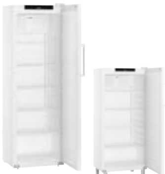
Armarios para gastronomía

Amplia gama de soluciones de refrigeración para refrigerar y congelar con la máxima seguridad.