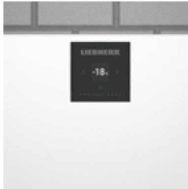
Electrónica básica • Pantalla monocromática • 3 botones táctiles