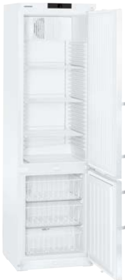
GCv 4010 3 ESTANTES REGULABLES 3 CAJONES