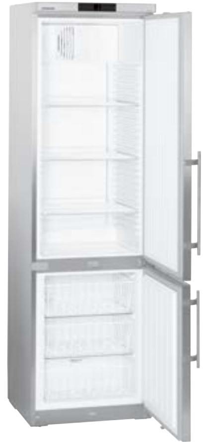
GCv 4060 3 ESTANTES REGULABLES 3 CAJONES