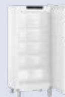
FFFsg 5501 Antiguo: GG 5210