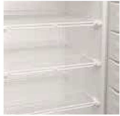
Refrigeración dinámica y congelador Smart Forst