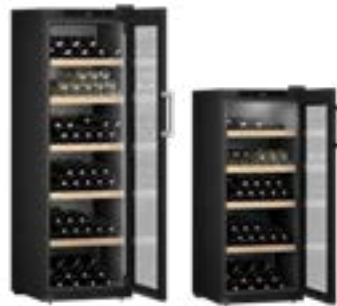
Armarios de bodega