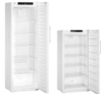
Armarios especializados para laboratorios y farmacias