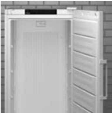
Equipos de acero con pintura epoxi blanca

Nuestra serie Performance se concentra en lo esencial: los aparatos de esta clase cumplen todos los requisitos para un almacenamiento seguro y estable a la temperatura. Todos los electrodomésticos Performance están hechos de acero blanco, disponibles en puerta sólida y equipados con la función SmartFrost en la variante de congelador.