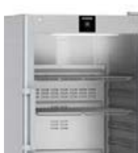
Sistema de refrigeración dinámica y congelador Smart Forst o No Frost