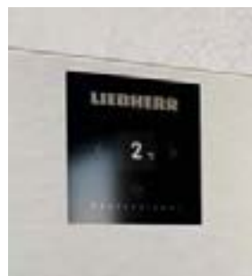
Electrónica básica • Pantalla monocromática • 3 botones táctiles