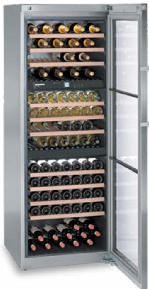
WTes 5872 VINIDOR INOX 178 BOTELLAS 75 cc