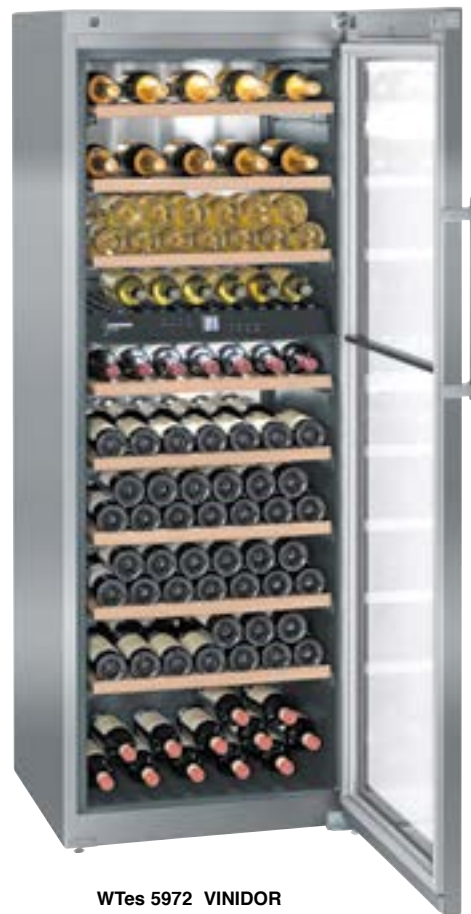
WTes 5972 VINIDOR