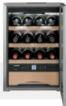
WKES 653 GRAND CRU INOX +5°C/+20°C 12 BOTELLAS 75 CC.

Sistema de atenuación de cierre SoftSystem.