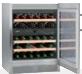
WTes 1672 VINIDOR