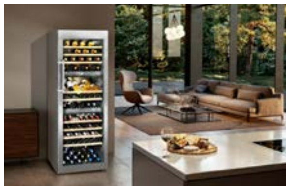
2 o 3 temperaturas

Equipados con dos o tres compartimentos separados regulables independientemente de forma precisa a entre +5 °C y +20 °C, los modelos Vinidor ofrecen la máxima flexibilidad. Así, en un solo aparato con tres compartimentos se pueden almacenar simultáneamente tintos, blancos y cavas a su respectiva temperatura ideal de degustación.