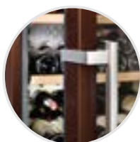
El sistema de atenuación de cierre SoftSystem