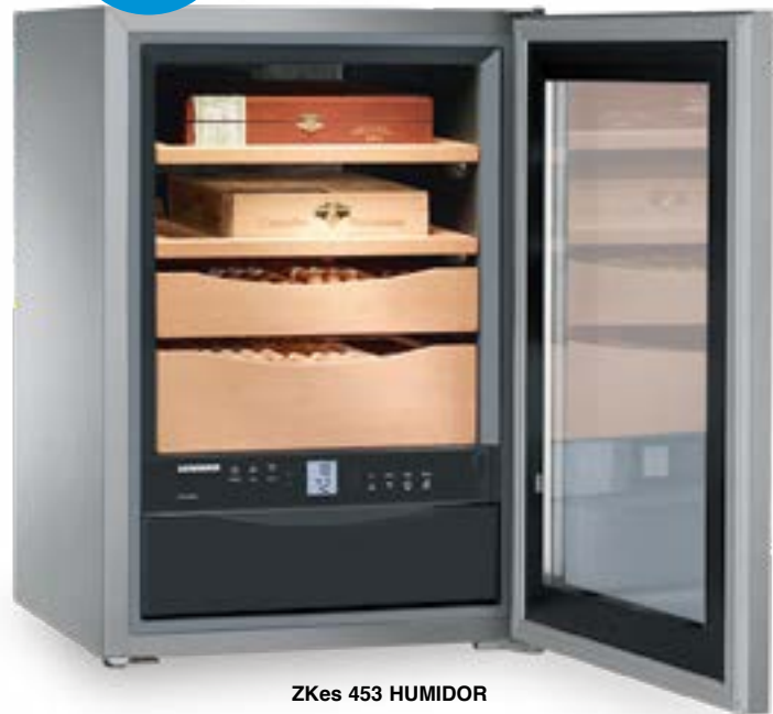
ZKes 453 HUMIDOR INOX +16°C/+20°C