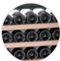
Estantes de madera, extraíbles.