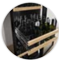
Cesta extraíble para botellas ajustable