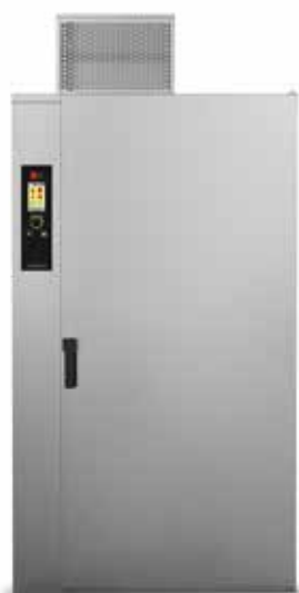
RRFC 20 E