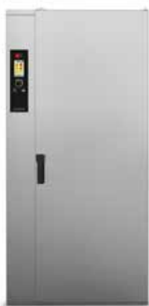
RRFT 20 E