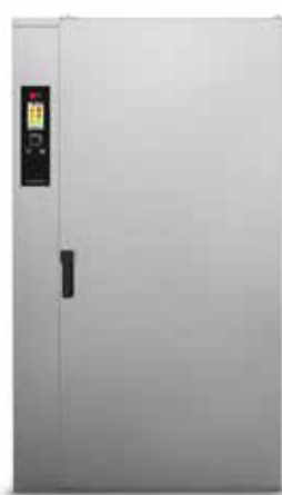
RRF 40 E