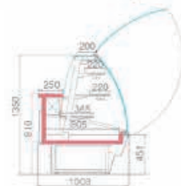
SWEET 2 LX