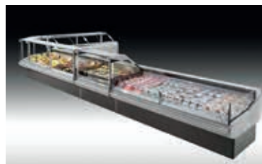
VENEZIA 2 MAXI SELF