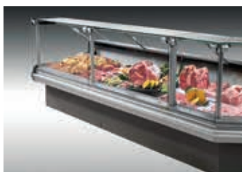
VENEZIA 2 MAXI VDA