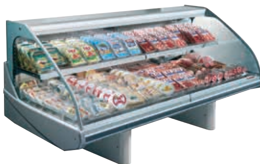
SIDNEY 3 H125