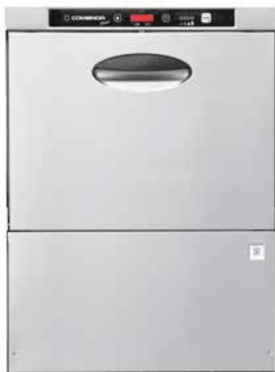
MODELO PF 45