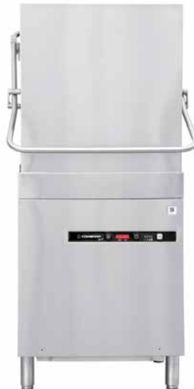
MODELO PC 09