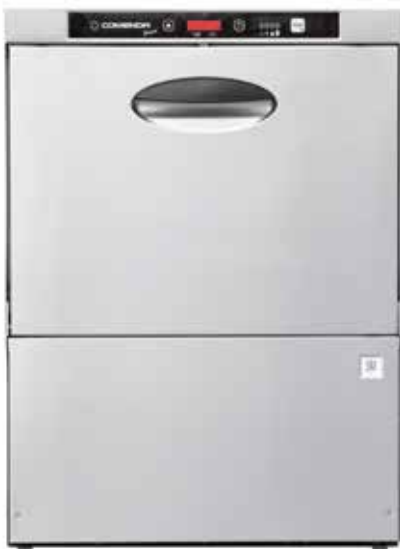
MODELO PB 24