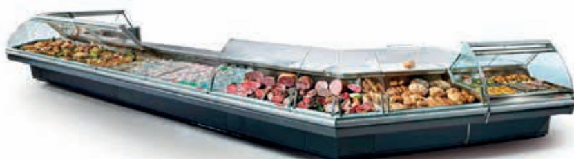
ASPEN 2 (versión cárter frontal)