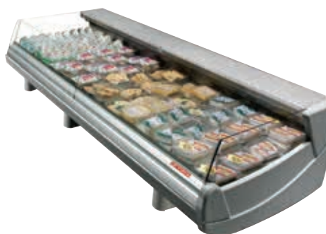
ASPEN 2 SELF (versión con patas)